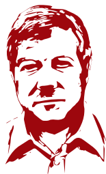
лицо здорового человека

Как правило, эти проявления возникают на фоне повысившегося артериального давления.