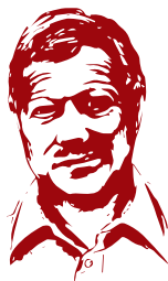
искаженное инсультом лицо